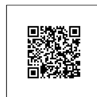
Zažádejte o vytyčení

Přílohy: Orientační zakres plynárenského zařízení, Detailní zakres plynárenského zařízení, Ověřená příloha žadatele